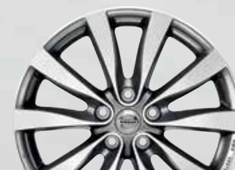
20" легкосплавный диск HIMALAYA 1 , серебристый (05)