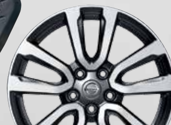
20" OE легкосплавный диск (02)